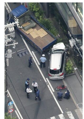
乗走し、トラックに衝突した乗用車(30日午後5時20分、大阪市中央区で)

大阪府の御堂筋の交差点で乗用車が一方通行の道路を逆走し、男女3人が重軽傷を負った。警察によると、この事故を起こしたとされる容疑者は糖尿病の持病があるためインシュリンの投与などの治療を受けていて、一時的に意識がもうろうとするなどの症状がしばしば出ることが明らかになった。